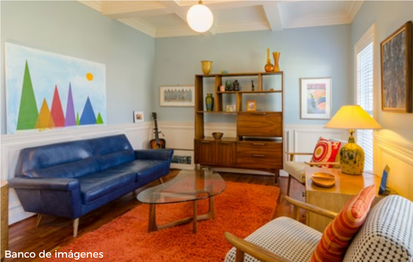
Banco de imágenes

Nueva colección. Consultar precio en tienda.